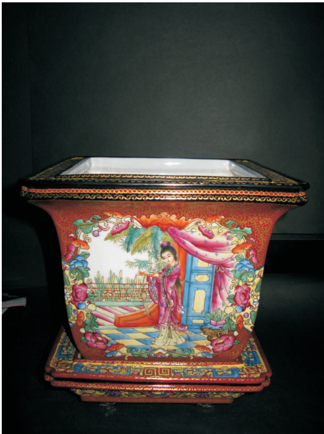
大清乾隆年制粉彩美女花盆