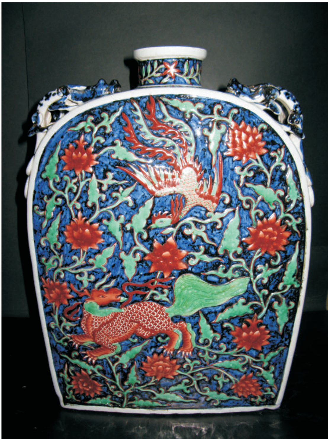
元至正九年青花五彩刻劃麒麟鳳凰穿花紋四系螭耳扁壺