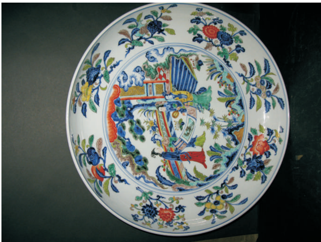
大明宣德年制青花五彩仕女琴棋書畫圖大盤